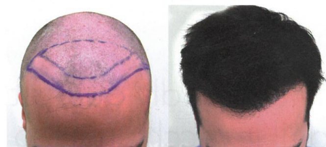
Risultati del post-trapianto con tecnica Fue & Dhi.

I pazienti possono affidarsi ad Istituto Helvetico Sanders con la massima tranquillità e la garanzia di potersi sottoporre a un intervento studiato appositamente per ottenere il massimo risultato raggiungibile per le proprie personali caratteristiche.